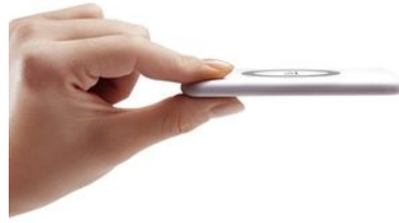
薄くて、軽い ワイヤレス充電器