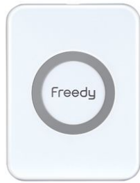
フリーディー ミニワイヤレス充電パッド