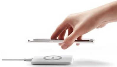
パッドの上に置くだけで簡単に充電ができます