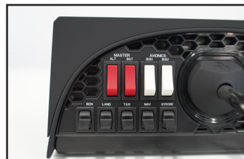
マスター、オルタネーター、アビオニクス、ライトスイッチを備えたスイッチパネルと、5接点イグニッションスイッチを搭載したビルトインスイッチパネル