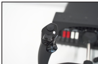
左ハンドル: 8方向ハットスイッチ x1、垂直2方向ロッカースイッチ x2、ボタン、プッシュ・トゥー・トーク(PTT)ボタン

スムーズに操作できるデュアルリニアボールベアリング機能の固体鋼シャフトを備えた180°回転角ヨークハンドル。中央の戻り止めやデッドゾーンがない減衰式自己調心メカニズムを採用