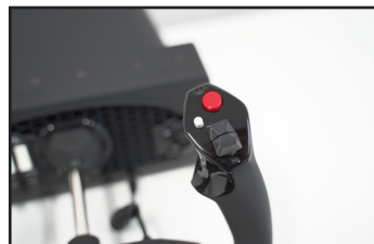
右ハンドル: 水平2方向ロッカースイッチ x2、大ボタン、小ボタン